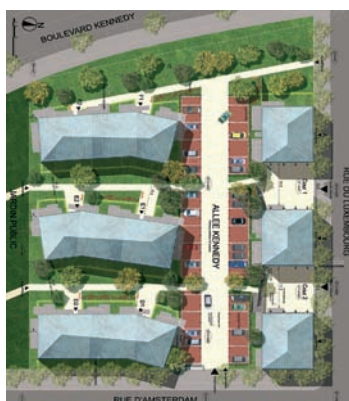
(Gilles Bouchez est l'architecte qui a créé le centre Atria de Belfort)

Le talus qui descend vers le boulevard Kennedy recevra un traitement particulier afin d'en faire un véritable élément paysager boisé et fleuri, qui contribuera à donner plus d'agrément au boulevard Kennedy. Afin d'obtenir le meilleur résultat possible, un paysagiste sera consulté pour l'ensemble des aménagements extérieurs.